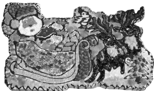
Mikulásváró délelőttre készült torta (2009. december 5.)